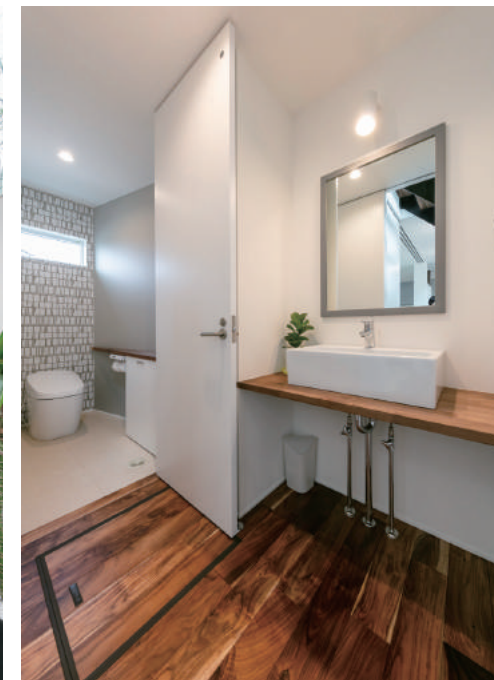
(中) 白を基調に、床や洗面台に木を取り入れて温かみを出した洗面室。奥には斜めに振った変形のトイレを配置。デザイン性の高い空間に仕上げた。