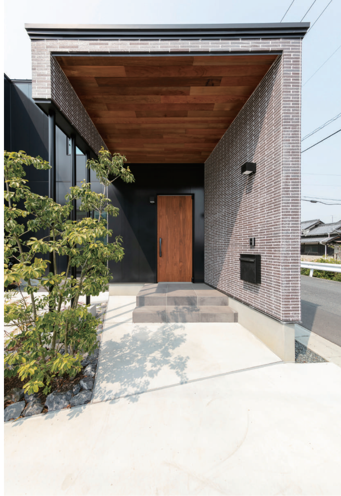
地形に合わせてつくられた立体的な玄関アプローチ。奥行きを強調しドアの奥へと視線を誘う。タイルや木、鉄の素材で見せ場のある空間に。