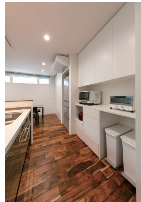
(右) ゆとりのある広さのキッチン内部。背面はすべて造作収納、上部には大容量の収納棚を設けた。家事動線上に必要なものがすっきりと収まる。