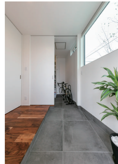
(左) 道路側の窓から光が差し込む玄関。絶妙な配置で外の視線をほどよく遮り、窓越しに映る樹木で室内に自然を取り込む。大容量の収納も確保。