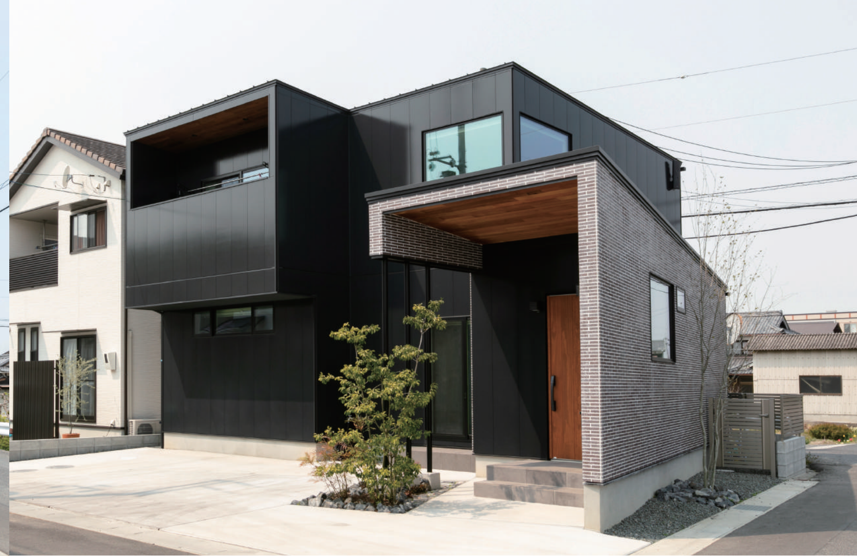
エントランスを斜めに振った台形のフォルム、凹凸のある壁面が特徴的な外観。黒のサイディングをメインに、木やタイルの素材感を際立たせた。