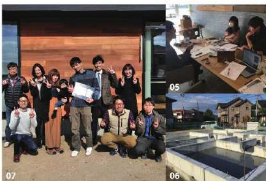
01/隣接駐車場にある掘りこたつ式のカウンター。パソコンやお子様のスタディースペースとして最適です。

「人とは違ったおしゃれなお家を建てたい」と思っている時に、建房さんを知りました。インパクトのある外観デザインに一目で魅了され、「ここで建てたい」と思ったのがきっかけです。契約前でありながらお金のこと、住まいのこともたくさん教えてくださいました。誰に対しても真摯に向き合うスタッフさん達を見て、デザインだけでなく、こだわり、会社の理念から、そのすべてが好きになり、虜になりましたね♡